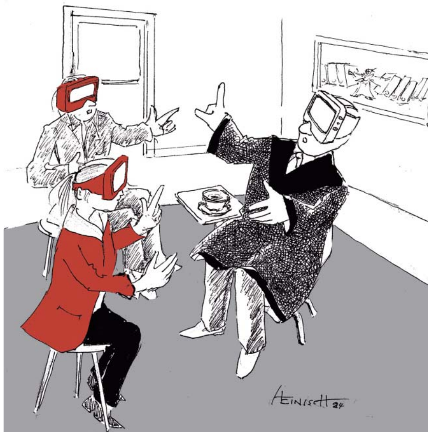
VR – Mandantengesprächstraining